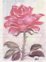
バラの香りA 岡田 利容 石巻アート所属

ニュース、情報は下記へ 社会部 052-231-1650・5919 Eメール shakai@chunichi.co.jp